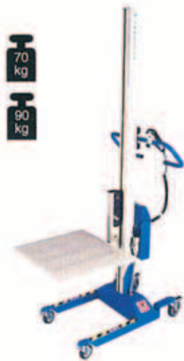
Lift & Drive 70 / 90E