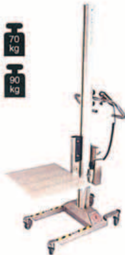
Lift & Drive 70 / 90ES

Il modello ECOLIFT viene costruito con portata di Kg. 70 e Kg. 90 con altezza utile di mm. 1250 e mm. 1500 . Dispone di una piattaforma in polietilene (PEHD 300) di dimensioni mm. 300 x 440. Tutta la struttura è elettrosaldata e sono intercambiabili: base su ruote, montante, piattaforma, batteria, timone di guida e telecomando. La struttura può essere fornita in alluminio/acciaio inossidabile oppure alluminio/acciaio verniciato. Velocità di sollevamento 80 mm/sec. Rotazione su quattro ruote girevoli diametro mm. 75 e mm. 100.